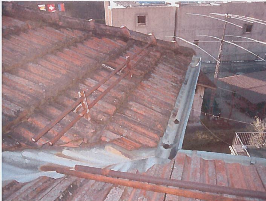
Foto stato tetto