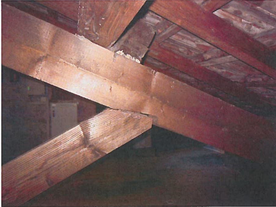
Foto sottotetto in tegole