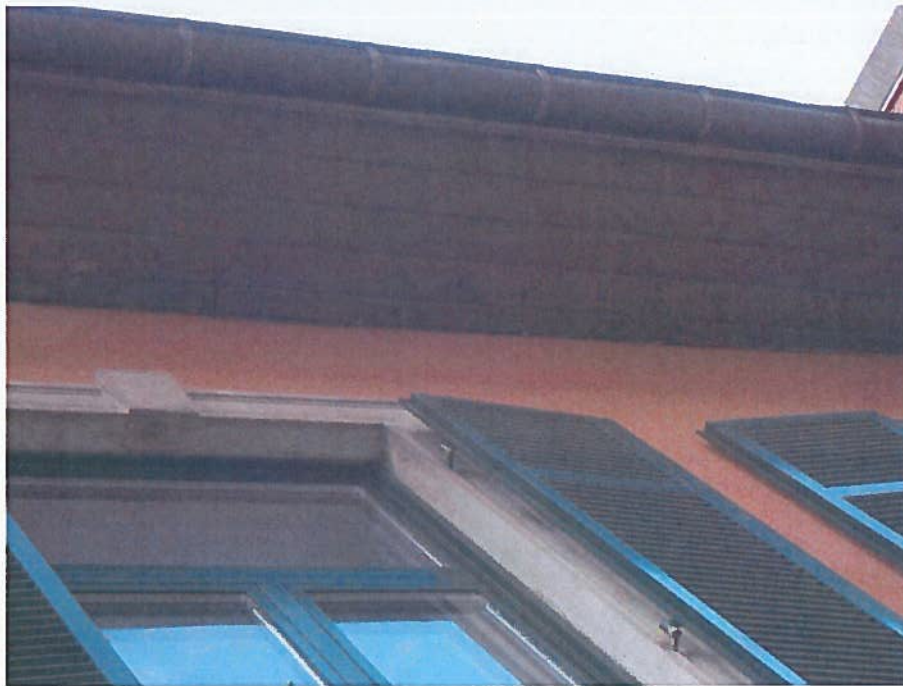
Foto capriata lato facciata ovest